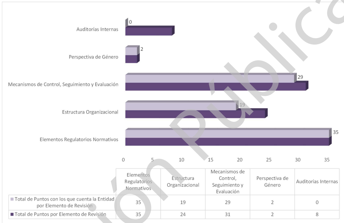
Gráfica 1 Cumplimiento de los Mecanismos de Control Interno Ejercicio 2020